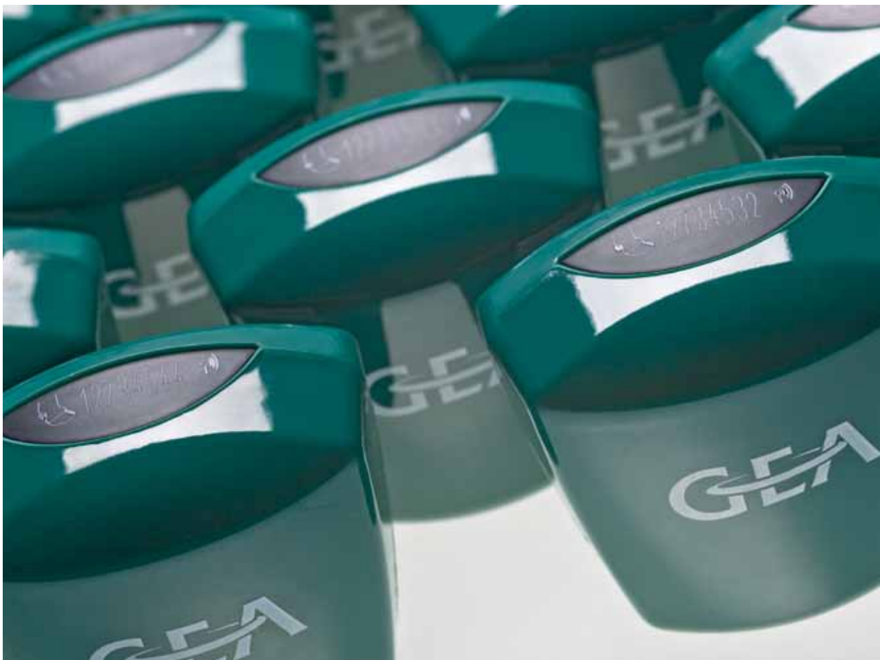
CowScout S в варианте StandAlone Без подключения в DMS 21 / DairyPlan

Респондер CowScout S внимателен и днем и ночью: датчик регистрирует движение животного в любой момент и с помощью антенн через короткие регулярные интервалы времени передает в процессор измеренные данные по активности. Процессор анализирует и сохраняет данные от всех респондеров CowScout S и моментально показывает высокую активность индивидуально по каждому животному.